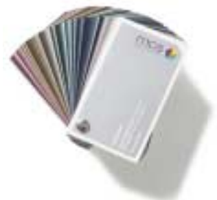
Metallisé/ Eisenglimmer (Pulverlack) Duroclear-Farbfächer mcs metallic colour system®