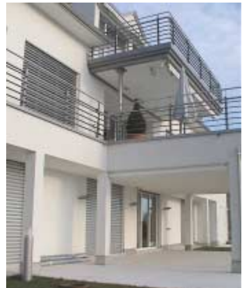
Geländer: mcs M S 10 - 20 Balkonstützen und Balkonrahmen: mcs E S 10 - 20 Gartenpoller: mcs E S 00 - 00 Wandlampen: mcs E S 10 - 05 Storen: mcs M S 00 - 00