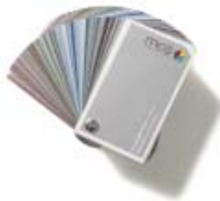
Eisenglimmer (Nasslack)-Farbfächer mcs metallic colour system®