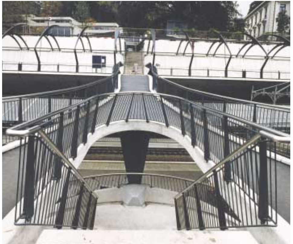
Bahnhof Stadelhofen Zürich. Architekt: Santiago Calatrava, Zürich. Verzinkerei: Galvaswiss AG

mcs bildet die logische Ergänzung zu RAL, DB-Eisenglimmer und NCS – ist aber im Gegensatz zu gängigen Farbsystemen Ästhetik- und Korrosionsschutz-System in einem. Die systematischen Reihen von Metallisé- und Eisenglimmer-Farbtönen und die fein abgestuften, nach Oberflächenstruktur und Metallisé-Effekt unterteilten Nuancen, ergeben eine zeitgemässe Auswahl dezenter Farbreihen für moderne architektonische Anwendungen.